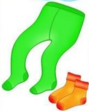
КОЛГОТКИ И НОСКИ